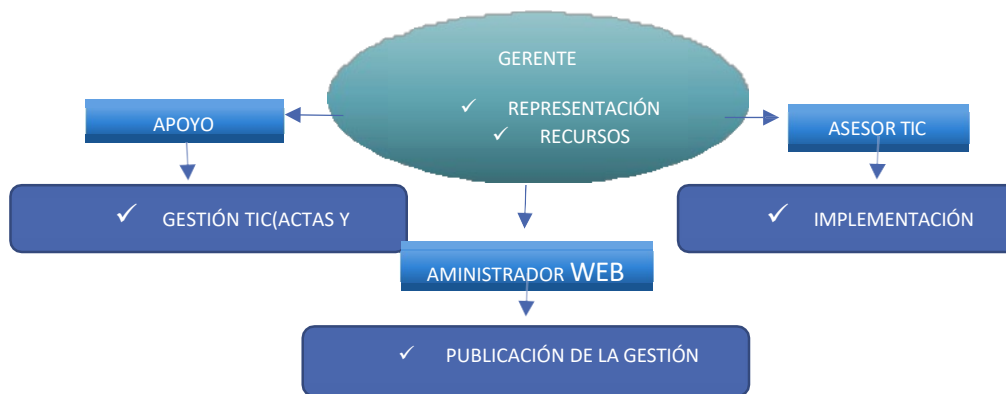
Imagen 2. Estructura Operativa de la Cooperativa AAA. La Bellezana

Teniendo en cuenta los objetivos estratégicos de TI plasmados en el Entendimiento estratégico - LI.ES.01 se muestra el mapa de procesos actual en la Cooperativa AAA. La Bellezana en el área de TIC, en donde se exponen los encargados y los procesos, con el fin de mejorar los procesos y procedimientos relacionados con la tecnología de la información dentro de este sistema.